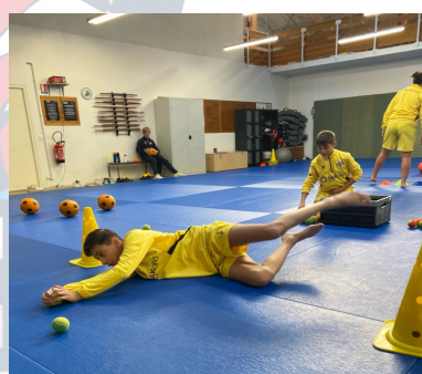
Espace Motricité & Réathlétisation