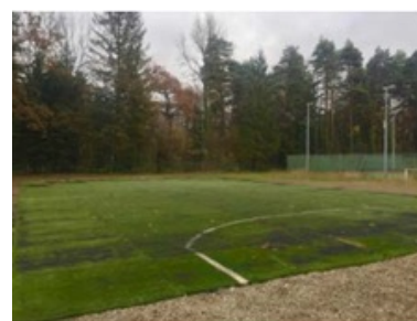
1 terrain en herbe & 1 zone synthétique